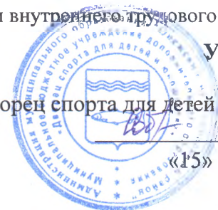
График режима рабочего времени: